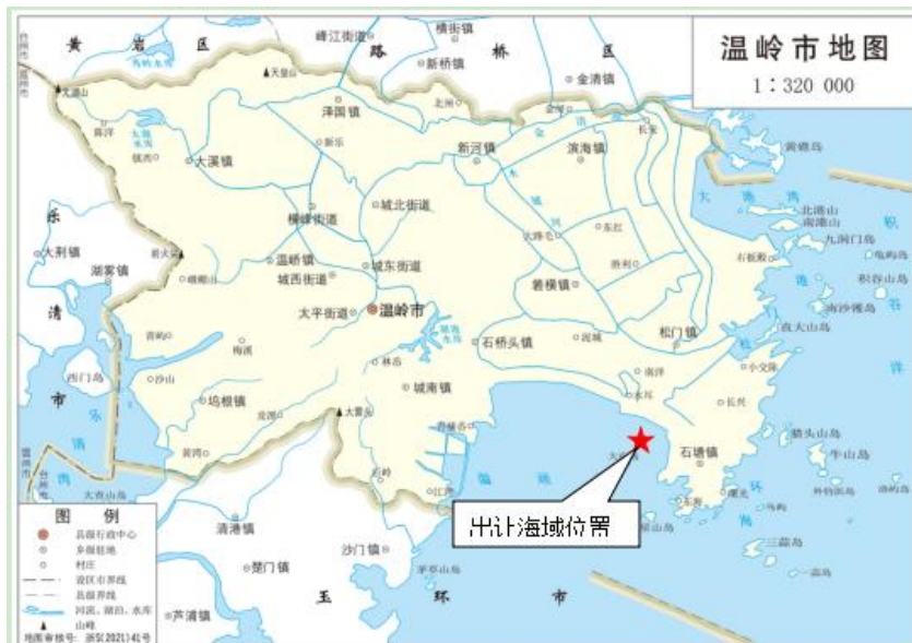
图 1 出让海域地理位置图

1、出让标的：温岭市东部石塘渔光互补光伏电站项目海域使用权。出让海域位于温岭市东南部苍山门外塘海域，距离温岭市区约15km。出让区块宗海面积为195.8821公顷。出让海域北邻温岭市东部松门渔光互补光伏电站项目和温岭市苍山门外塘区块养殖用海项目，东面松门齐门塘，西面、南面为开敞式海域。见图1出让海域地理位置图、图2出让区块范围。