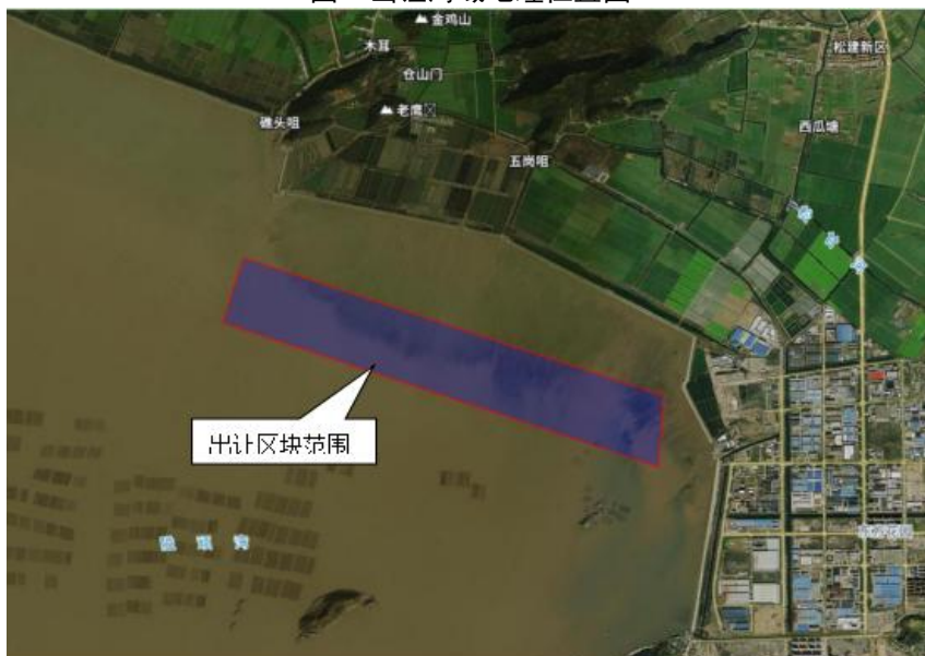
图 2 出让区块范围